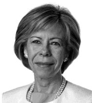
Maria de Belém Roseira Martins Coelho Henriques de Pina