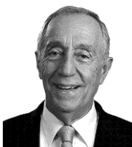
Marcelo Nuno Duarte Rebelo de Sousa