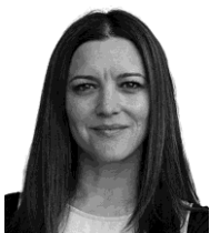
Marisa Isabel dos Santos Matias